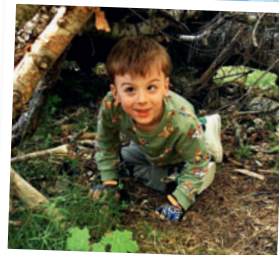
Viggo i kojan.