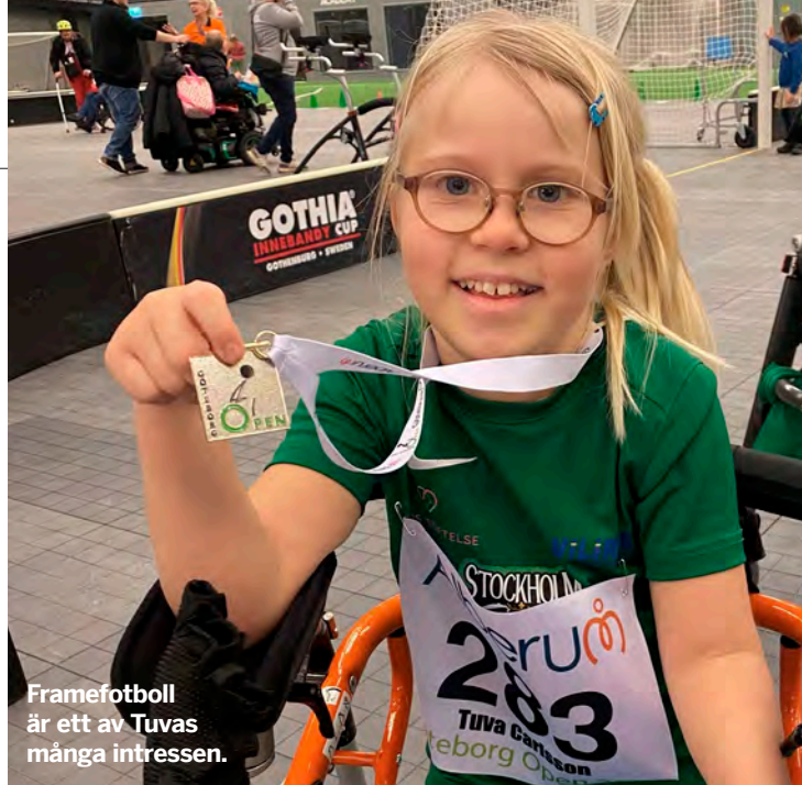
Framefotboll är ett av Tuvas många intressen.

30 Kåseri: Vad vill du bli när du blir stor?