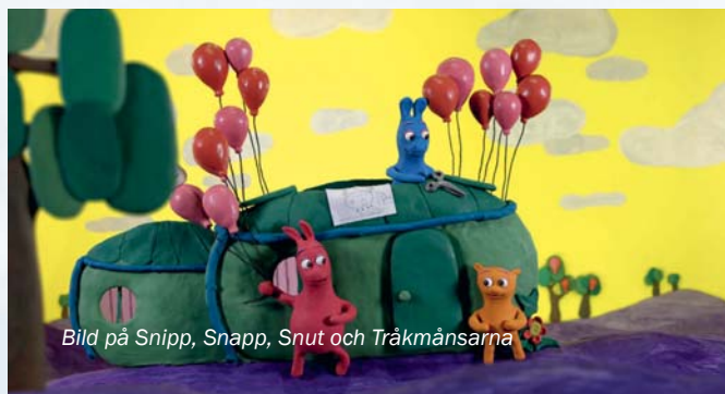
Bild på Snipp, Snapp, Snut och Tråkmånsarna