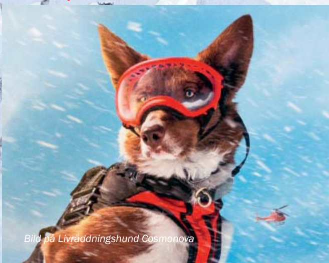
Bild på Livräddningshund Cosmonova

Hunden kallas för människans bästa vän men visste du att en hund kan vara en superhjälte också? Det kan den! Det finns hundar som hittar människor som gått vilse i skogen, som hjälper personer med sjukdomar eller är livräddningshund ute på sjön. Tillsammans med sin matte eller husse jobbar dom för att hjälpa de som har hamnat i nöd. På Cosmonova visas filmen "Superpower dogs" fram till veckan före jul. Den passar från 4 år.